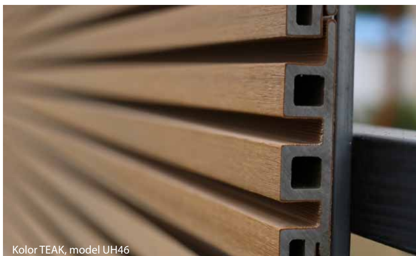
Kolor TEAK, model UH46